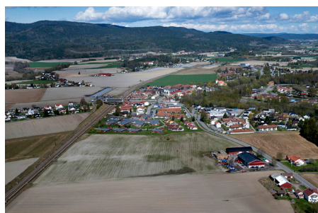
SANDE: sett fra luften, 28. april 2015.

I 2015 må vi gjøre en del forberedende jernbaneteknisk både sør og nord for anlegget. De som bor langs eksisterende spor fra Sande til Holm, og fra Fegstad til Skoppum, vil merke økt aktivitet. Dette arbeidet er lite forutsigbart, men vi informerer så godt vi kan.