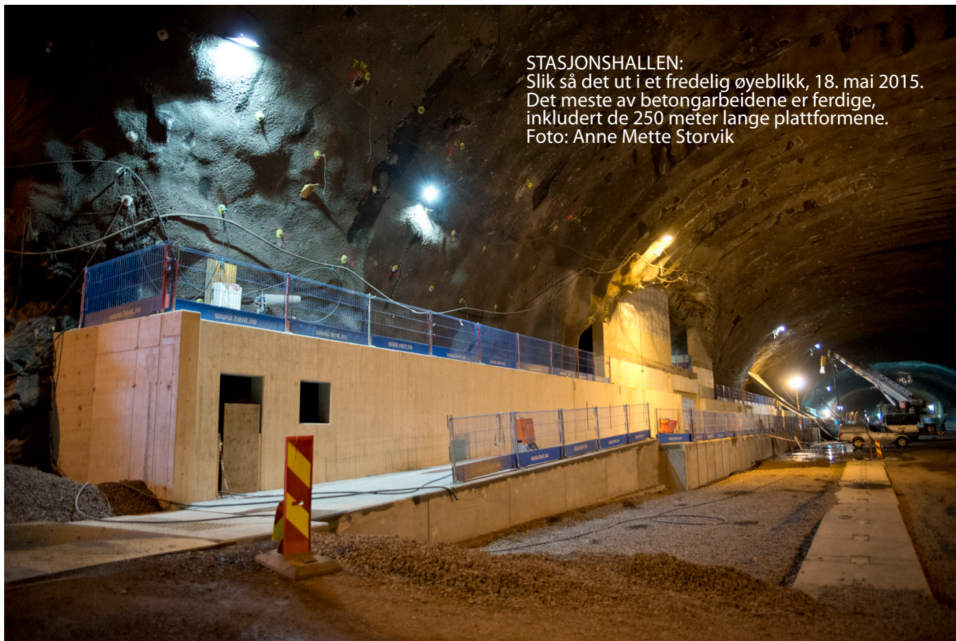
STASJONSHALLEN: Slik så det ut i et fredelig øyeblikk, 18. mai 2015. Det meste av betongarbeidene er ferdige, inkludert de 250 meter lange plattformene.