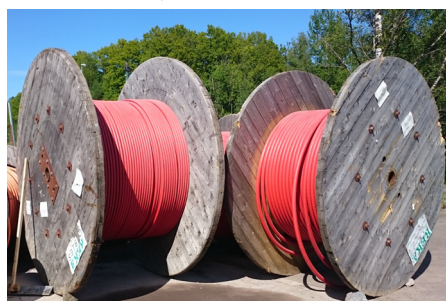
STORE: Jernbane krever mye kabler.

-Ca 160 km av totalt 250 km signalkabel er lagt -14 km strålekabel for nødnett og kommersielle mobiloperatører er ferdig -113 km fiberkabel er på plass -Ca 15 km av totalt 60 km jordingskabel er lagt -13 km av totalt 24 km håndløper med led-lys er montert -150 km av totalt 320 km lavspentkabel er lagt -5 km av totalt 13,5 km høyspentkabel er på plass Alle rømningstunnelene er nå lukket og låst, Holm og Fegstad er sikret og vakter patruljerer områdene.