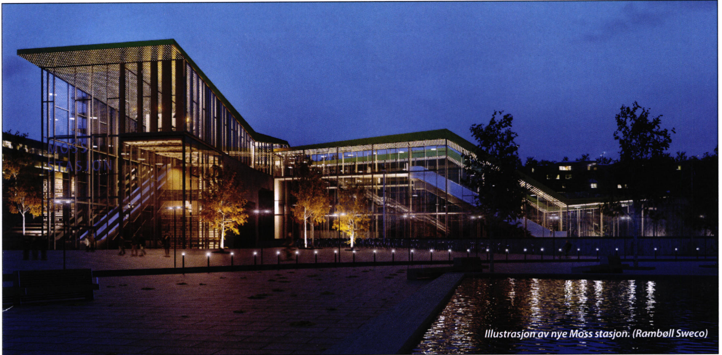
Illustrasjon av nye Moss stasjon. (Rambøll Sweco)