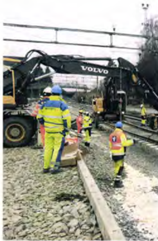
Bildet viser etablering av ny plattform.

For å få plass til undergangen må vi lage en ca. 10 meter bred, 38 meter lang og 5 meter dyp byggegrop mellom plattformene. Dette innebærer at vi må fjerne om lag 3000 m 3 med fjell og 5000 m 3 med løsmasser under sporene. Massene skal fjernes ved hjelp av sprenging, graving, pigging og boring.