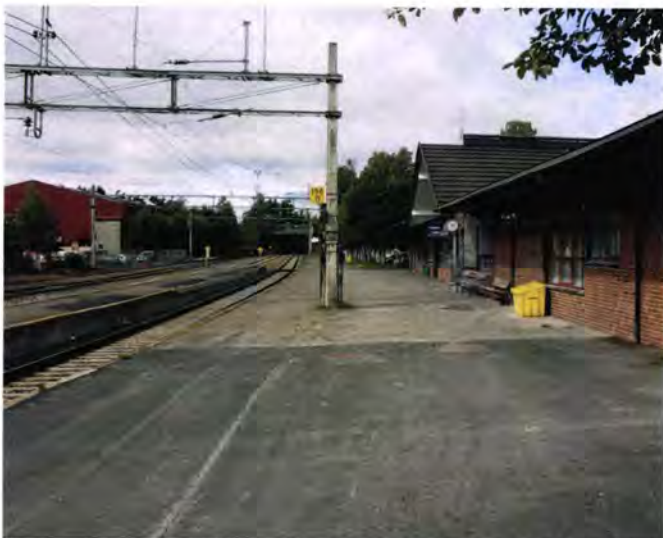
Mellomplattformen er revet og det er bygd en ny plattform til spor 2.

Jernbaneverket oppgraderer Moelv stasjon med to nye plattformer og undergang med trapp og heis.