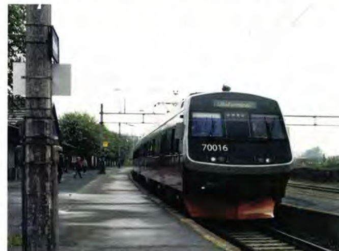
NSB kjører buss for tog i de togfrie periodene.