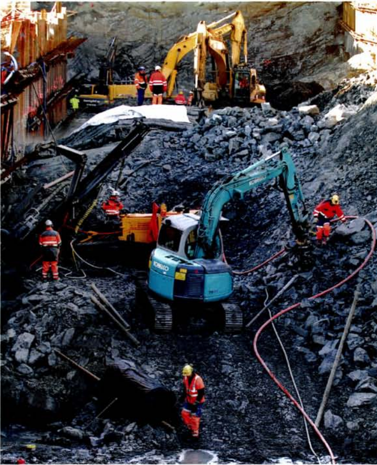
Illustrasjonsbilde som viser etablering av byggegrop.