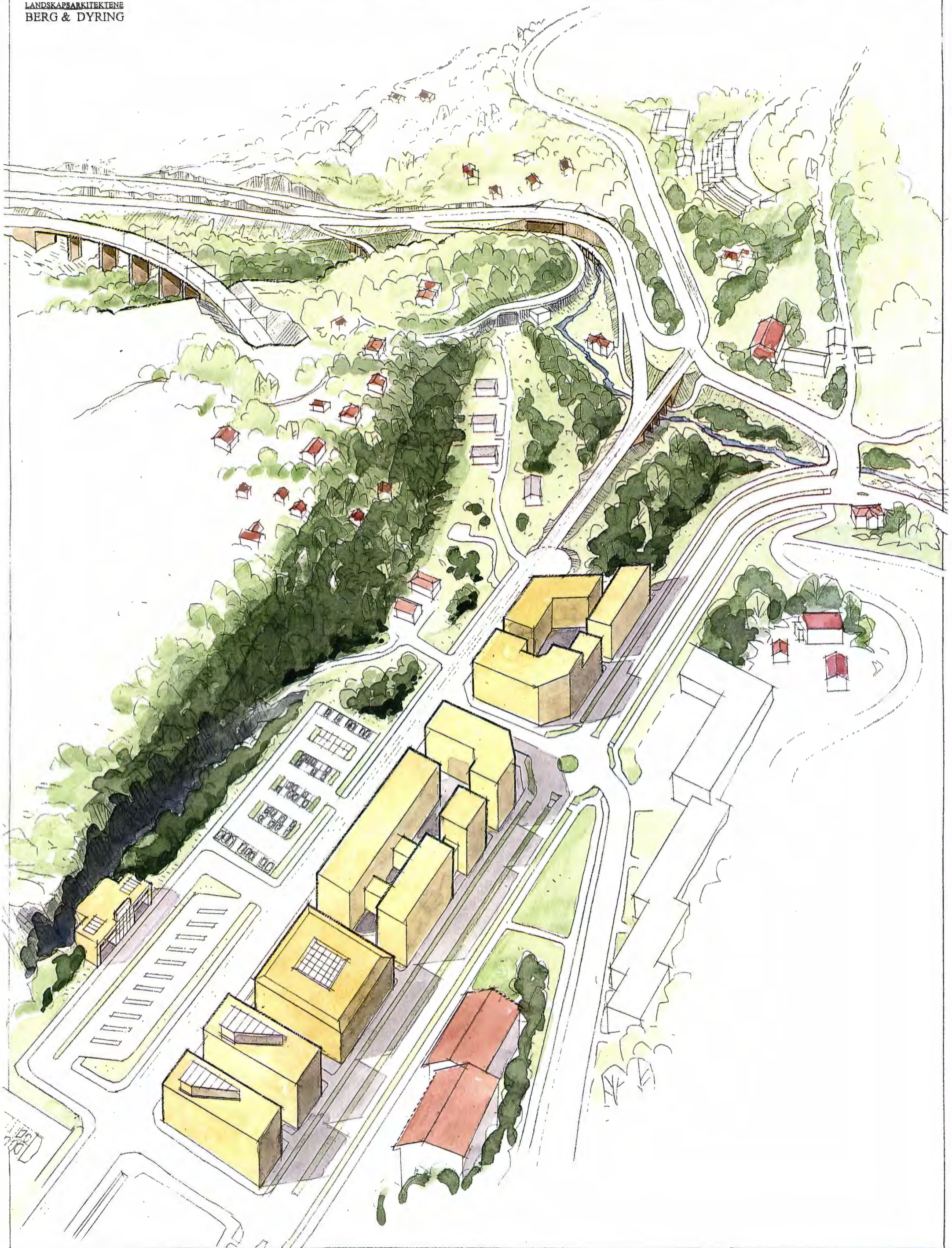
HAUKETO STASJON LØSNING 3 : STASJON I FJELL