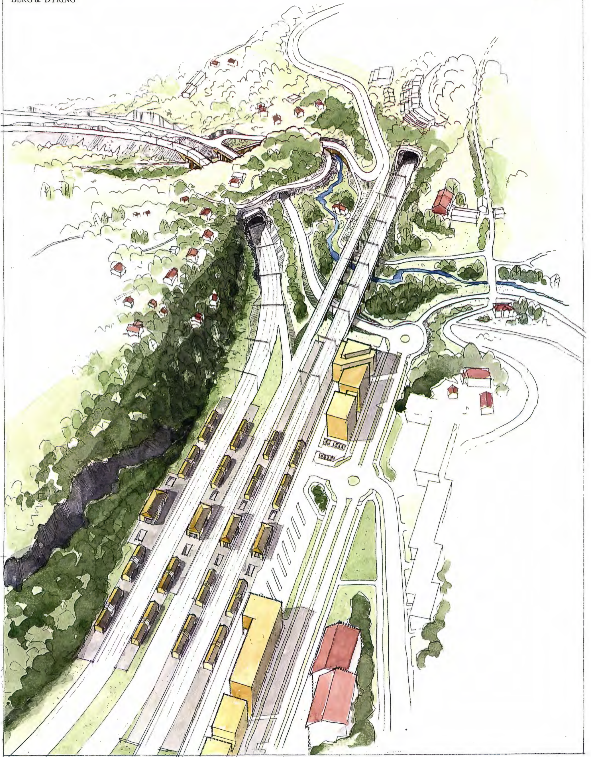
HAUKETO STASJON LØSNING 1 : STASJON I DAGEN