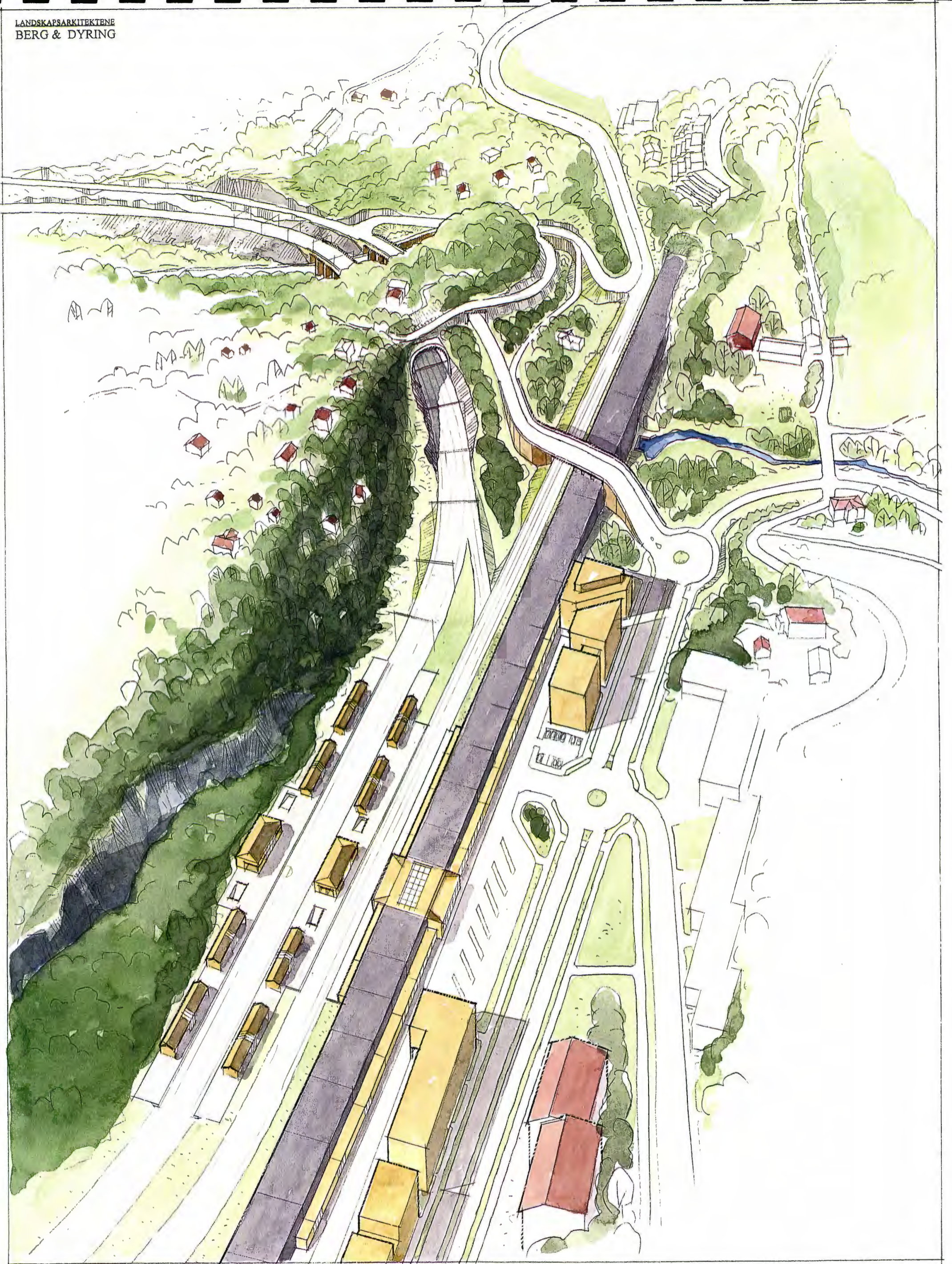
HAUKETO STASJON LØSNING 2 : STASJON I NEDSENKET KULVERT