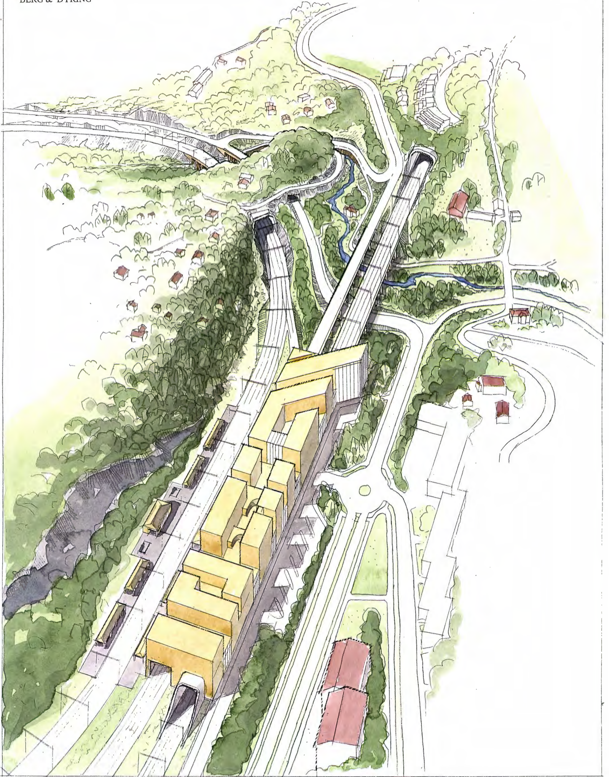
HAUKETO STASJON LØSNING 1 A : STASJON I DAGEN MED OVERBYGG