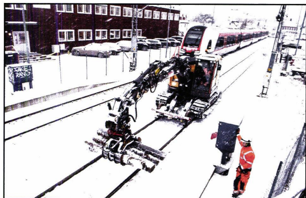
RIVING AV SPOR 5: I begynnelsen av januar ble skinnene fjernet.