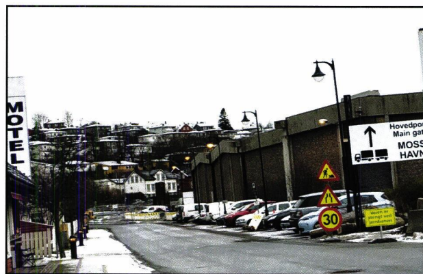
OSLOLAGERET: Parkeringsplassene til Bastø Fosen langs Oslolageret blir en saga blott når havneveien i Strandgata utvides til tre felt.

Ny strekning tas etter planen i bruk i 2024, og arbeidene avsluttes i 2025.