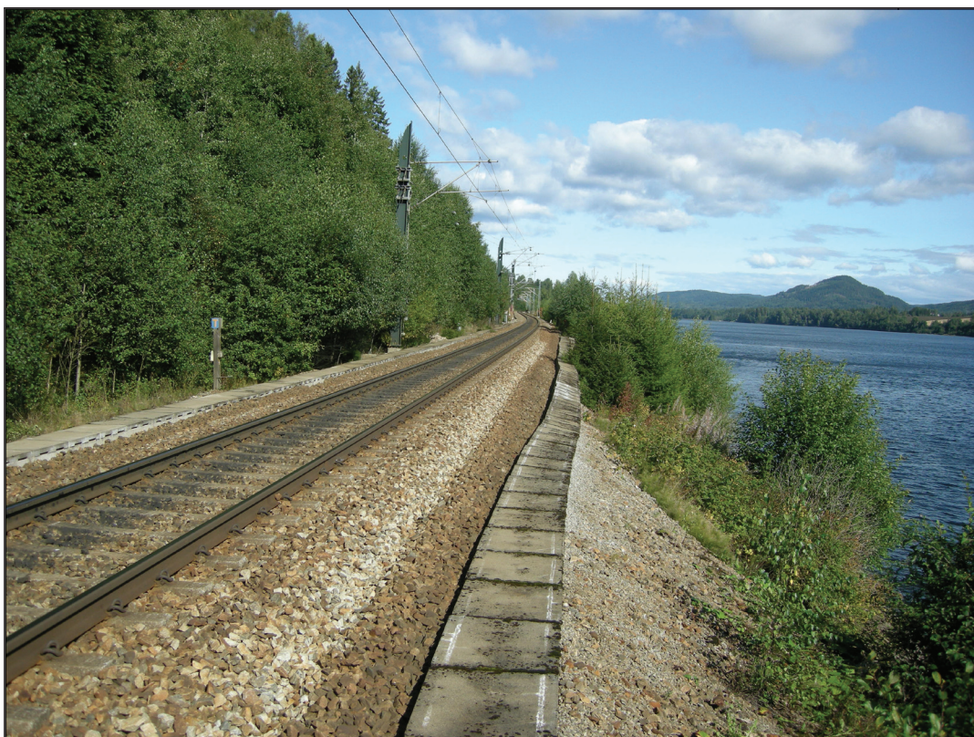
Enkeltspor langs Vorma. Fyllingen for dobbeltsporet vil komme på utsiden av dagens spor.