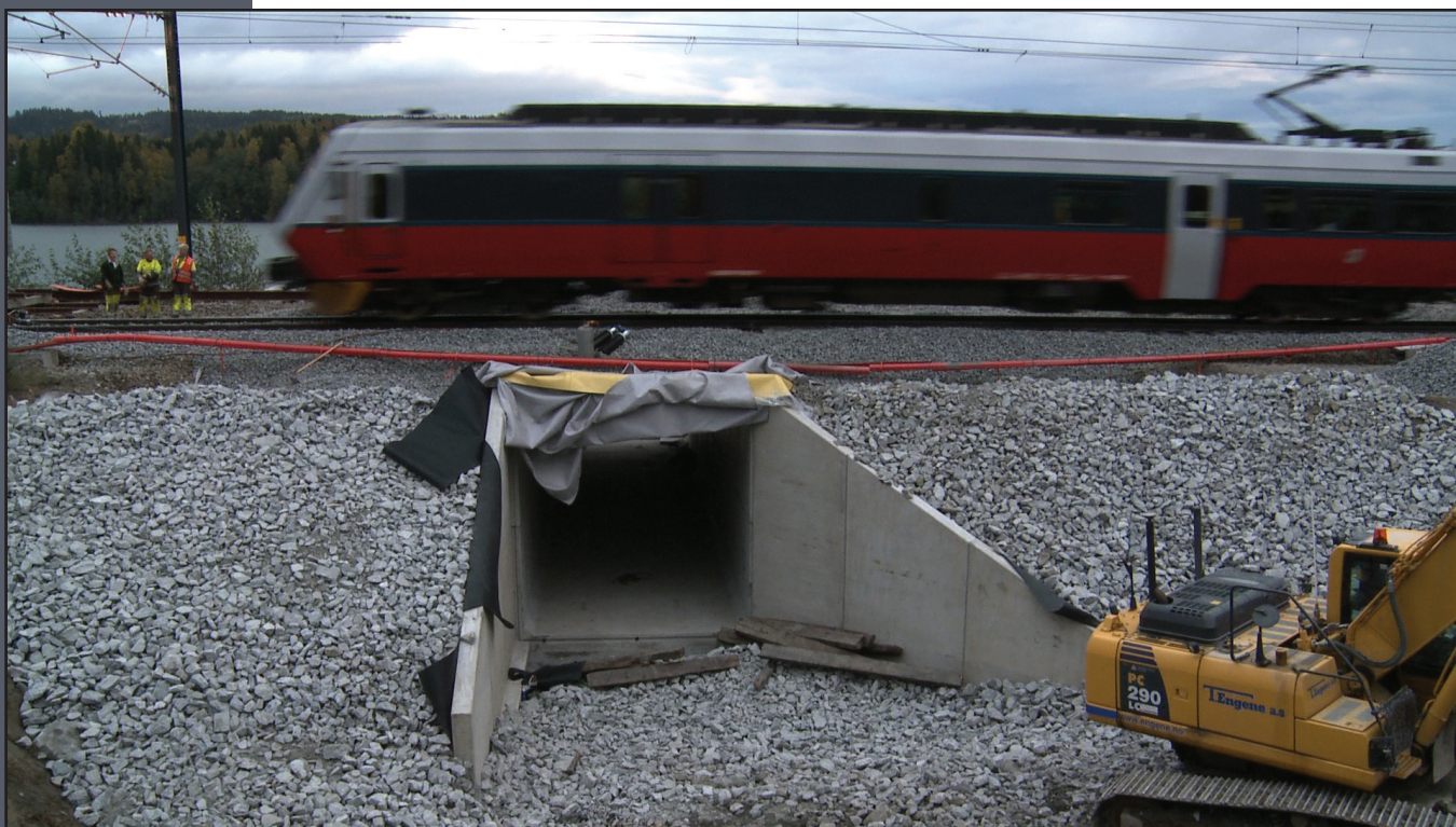
Første persontog passerer undergangen som ble bygget i september 2009 ved Eidsvoll stasjon.

- Vi er derfor tidlig ute med utfyllingen, sier Ausland. Selvom det er langt frem til dobbeltspor, vil kryssingsspor og vendespor på Eidsvoll være til nytte for togtrafikken. Kryssingssporet vil gi mindre ventetid særlig for godstransporten, og vendesporet har betydning for hvor mange persontog som kan snu på Eidsvoll stasjon.