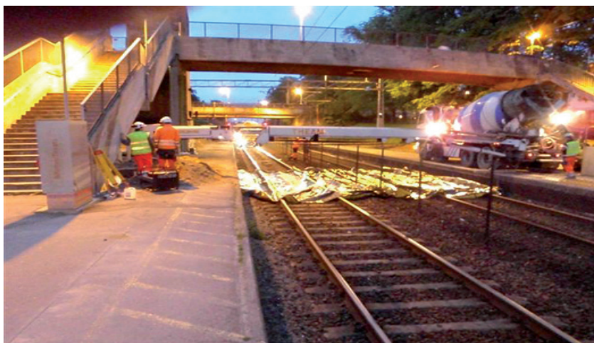
I 2010 ble togtrafikken på Ski stasjon stoppet seks ganger i forbindelse med arbeidene.