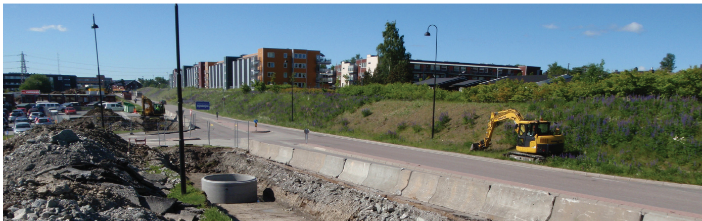
Kabelomleggingen ble godt synlig langs vestveien, der både vei og fortau måtte snevres inn på grunn av gravearbeidene.