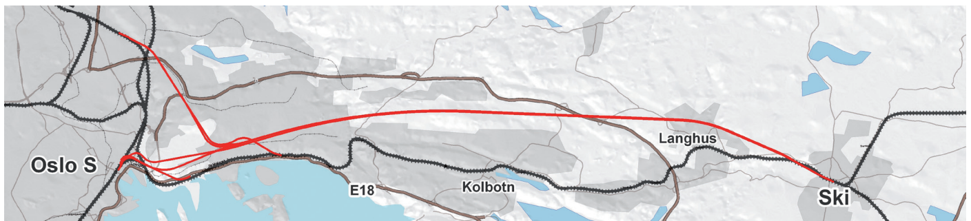
Slik ser Follobanens traseen ut. Forbindelsen mellom Follobanen og Alnabru er også med i planleggingen. Illustrasjon: ViaNova/Aas-Jacobsen

Konsekvensutredningen for Follobanen sendes på høring i januar 2011.