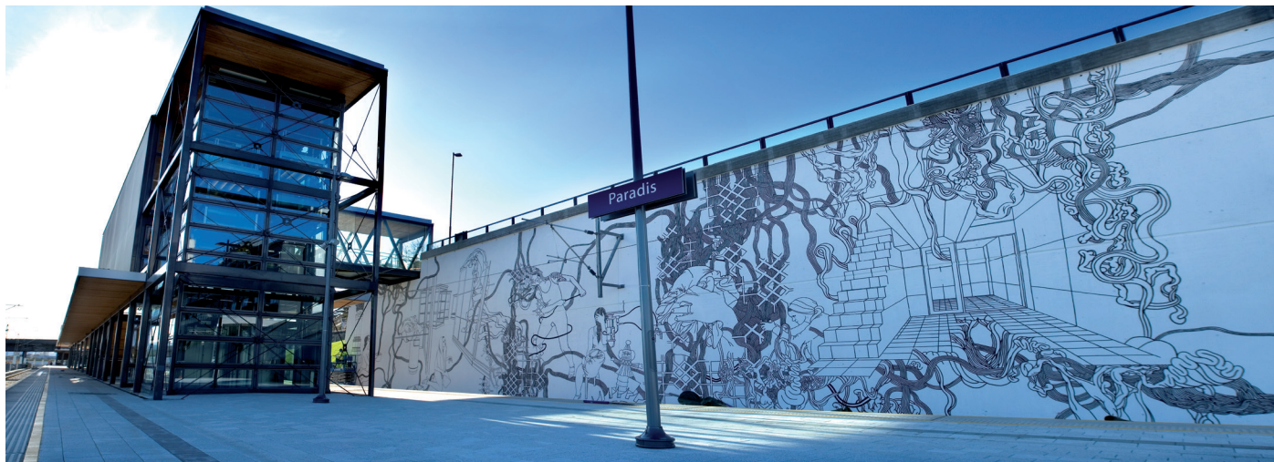
Utsmykkingsprosjektet av Paradis stasjon i Stavanger ble godt mottatt av både togbrukerne og lokale myndigheter.