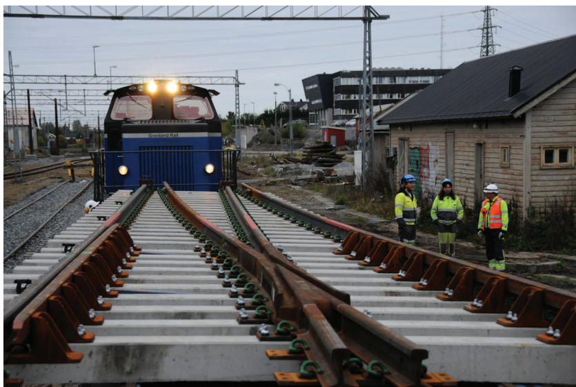
I 2011 vil arbeidene medføre endringer på sporarrangementet på Ski stasjon. En ny sporveksel ankom i august 2010, og skal monteres på plass i løpet av våren.