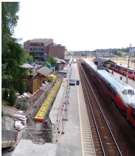
Framkommeligheten på stasjonen har tidvis vært redusert på grunn av anleggsarbeidene.