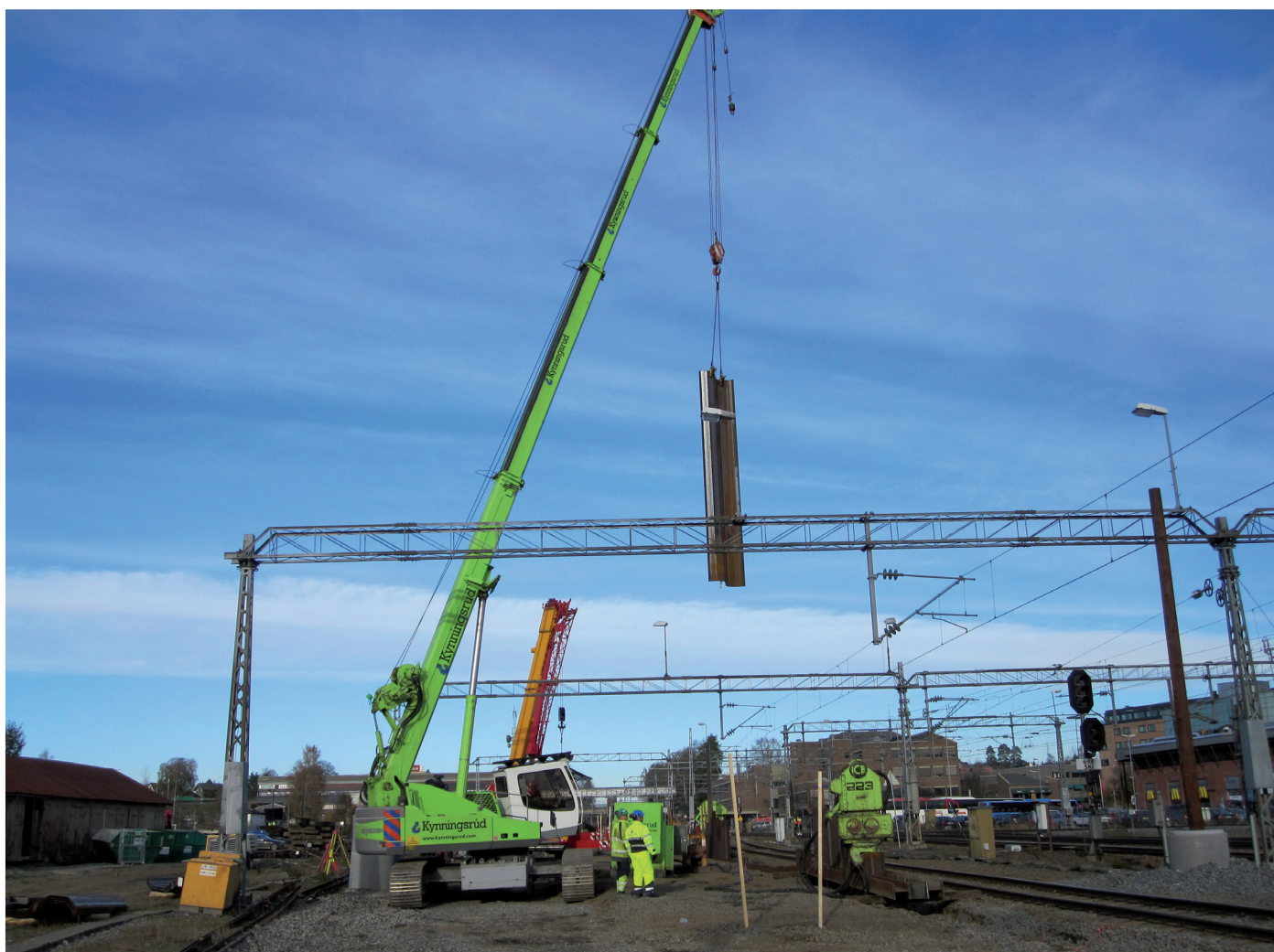
Spuntarbeider på Ski stasjon i september 2010.