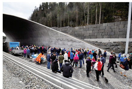
Åpen dag ved Hallevannetbrua.

Du kan nå følge med på hva som skjer av utbygging på Vestfoldbanen. Søker du på Jernbaneverket Vestfoldbanen, finner du siden vår. Du kan da like den for å få med deg alt det spennende som skjer hos oss.