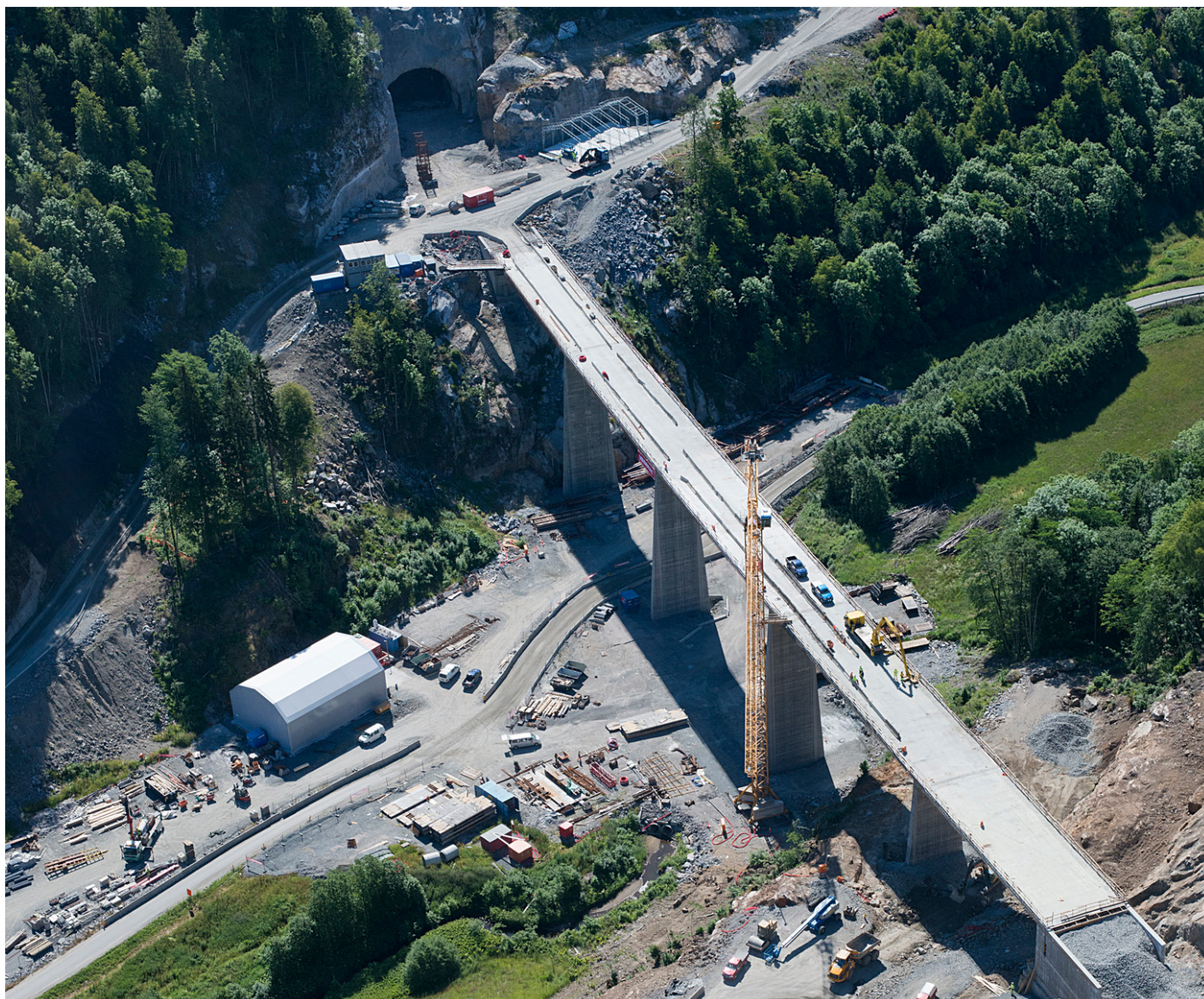
Ønna bru innerst i Langangen.

Farriseidet - Porsgrunn prosjektet er inne i en hektisk fase og det er mye og stor aktivitet på våre anlegg langs hele traseen.