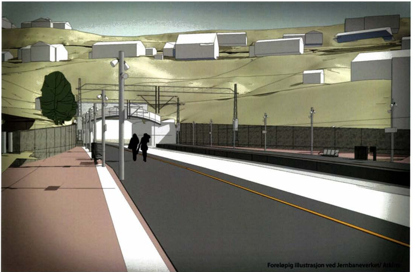
Foreløpig illustrasjon ved Jernbaneverket/ Atkins

Illustrasjonen viser forlengelsen av plattformene østover mot tunnelen og støttemurene som skal etableres langs plattformene.