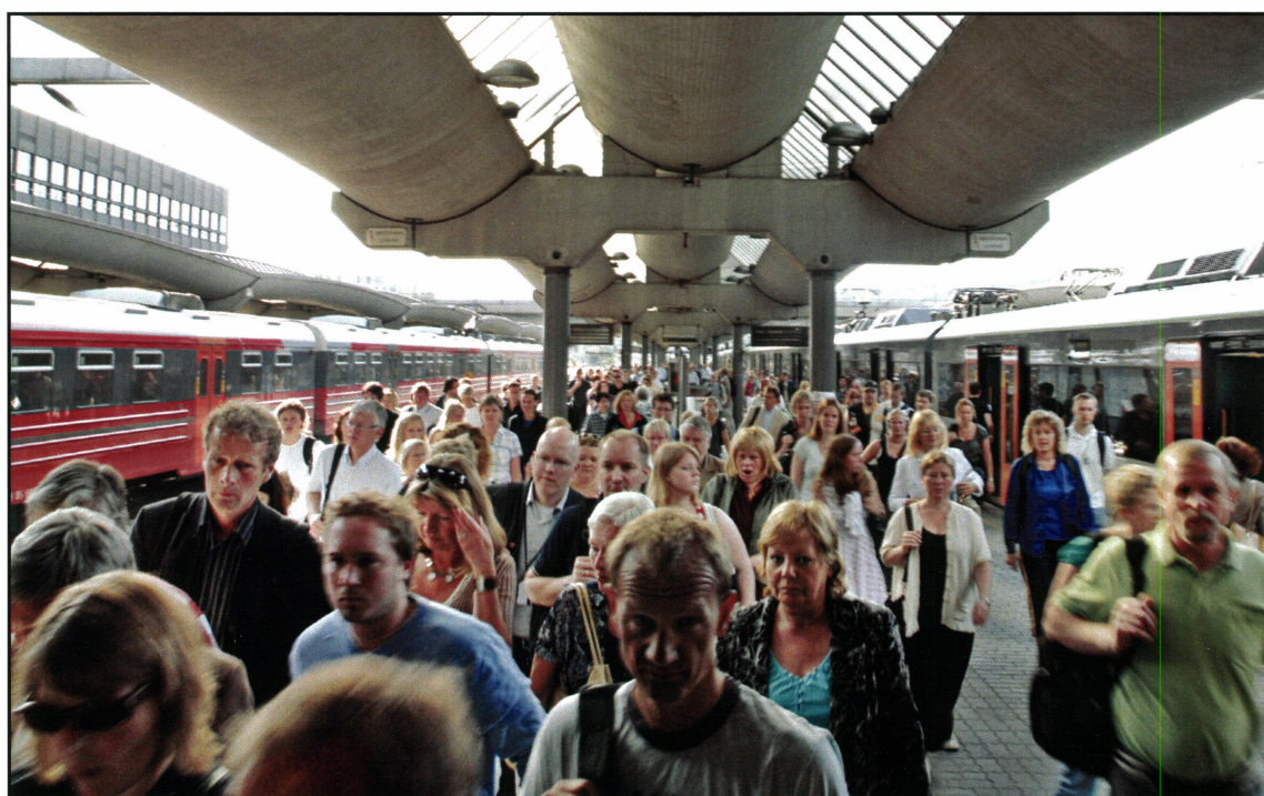
Morgenrush på Oslo S fra Ski.

Selv uten stopp på Follobanen vil både Kolbotn og Vevelstad kunne få et bedre togtilbud med Østfoldbanen enn i dag. Årsaken til dette er at Follobanen frigjør kapasitet på Østfoldbanen, slik at det er mulig å kjøre flere lokaltog. Dette kommer også de andre lokaltogstasjonene til gode. En oppgradert Kolbotn stasjon tilrettelagt for bussmating vil være et viktig bidrag til utvikling av et godt transportsystem i Sørkorridoren.