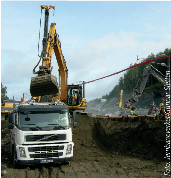
Bildet viser arbeider på Dorr bru i august, her vil det også foregå en rekke arbeider i september.