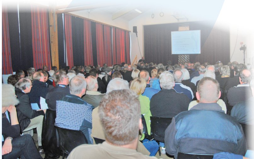
Fellesprosjektet E6-Dovrebanen gjennomførte i siste halvdel av mai fem grendemøter som var godt besøkte. Det vil bli holdt nye grendemøter høsten 2009.

I forbindelse med varsel om oppstart av reguleringsplan på strekningen Minnesund - Espa, har det kommet inn over 70 innspill. Generelt er innspillene knyttet til løsning for lokalveg, adkomstløsninger for boliger, støy, brønner og andre elementer som er knyttet til eiendommer. Fristen for å komme med innspill til varsel om oppstart har gått ut, men har du innspill som kan være av relevans for reguleringsplanen er det fint om du sender disse til post@e6-dovrebanen.no eller Statens vegvesen Region øst, Postboks 1010, 2605 Lillehammer.