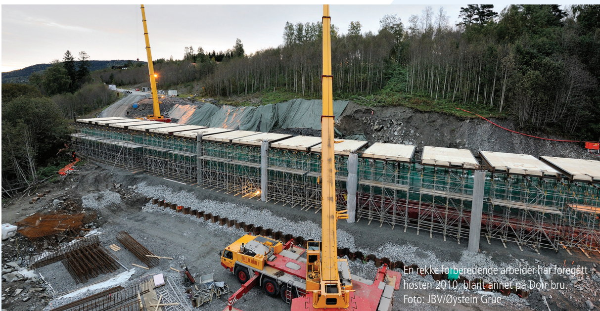
En rekke forberedende arbeider har foregått høsten 2010, blant annet på Dorr bru.

Prosjektet er også i gang med å jobbe med prosjektets finansiering, en sak som før byggestart må behandles av berørte kommuner, fylkeskommuner og til slutt vedtas av Stortinget.