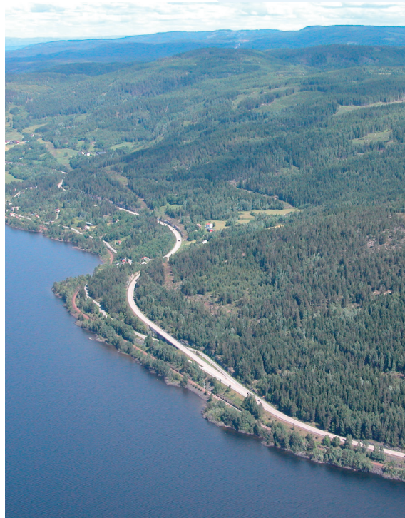
Her mellom Korslund og Brøhaug legges Dovrebanen i tunnel. Tunnelen blir 1,5 km lenger enn opprinnelig planlagt.

Fellesprosjektet er i gang med en modernisering og omlegging av nettsidene. Vi beklager at dette vil ta noe tid, men i mellomtiden finnes de viktigste plandokumentene på etatens nettsider.