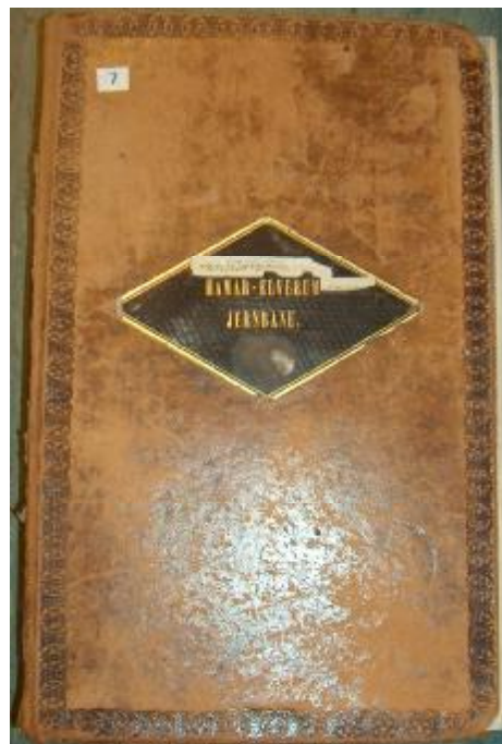
Alle fotografiene viser takstprotokoller i bibliotekets magasin.